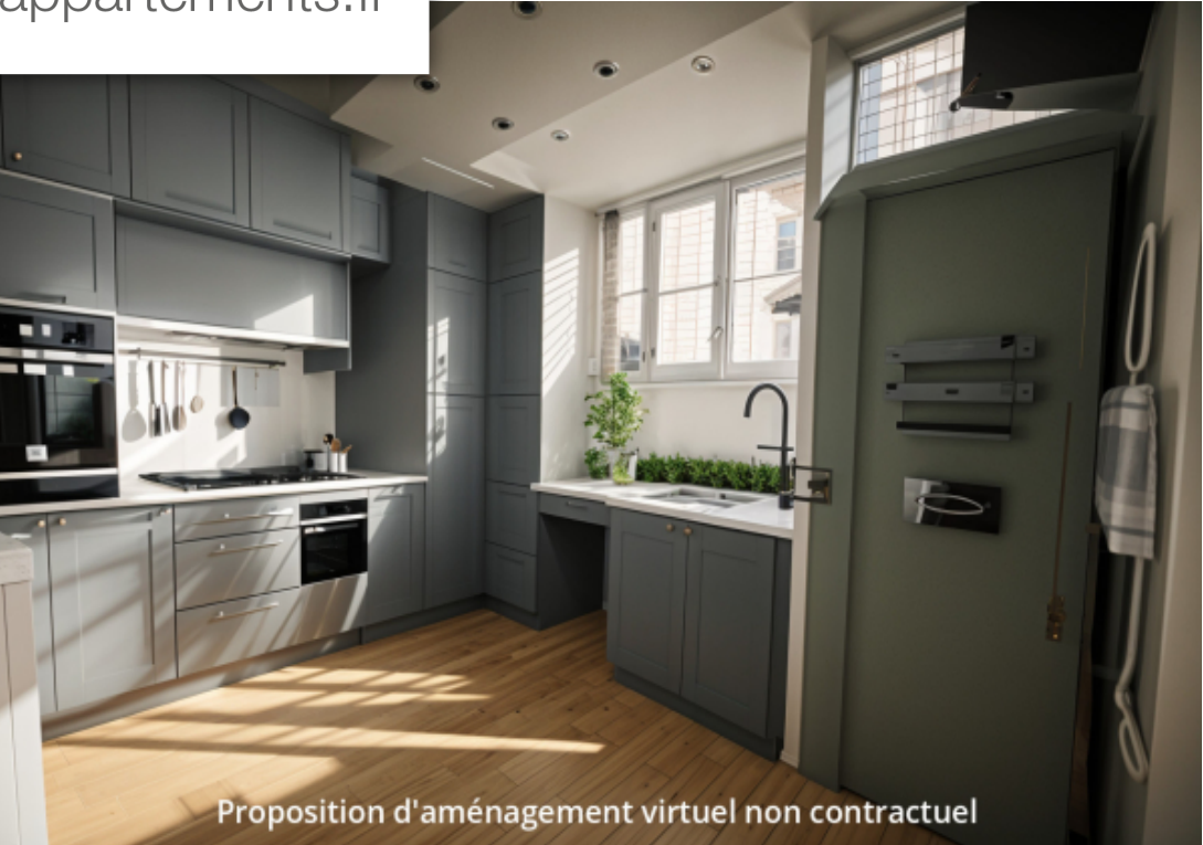
Proposition d'aménagement virtuel non contractuel