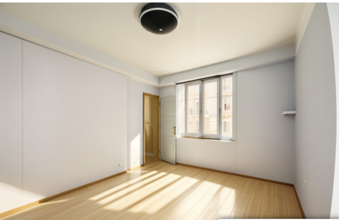
Proposition d'aménagement virtuel n°