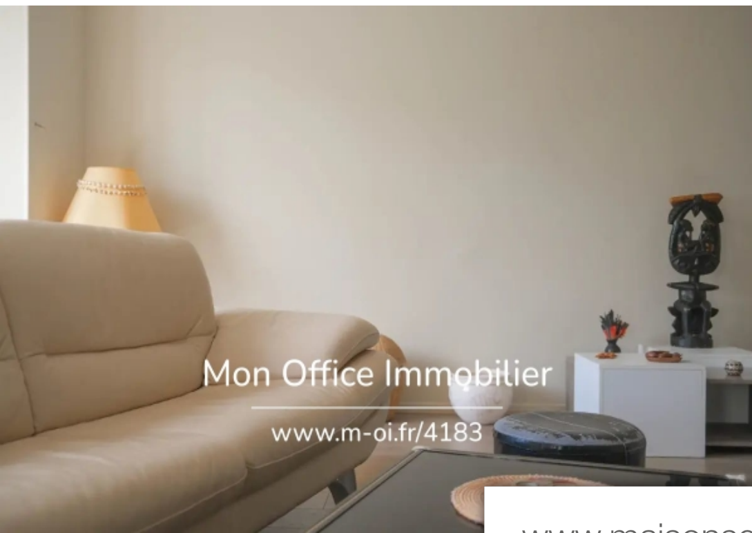
Mon Office Immobilier www.m-oi.fr/4183