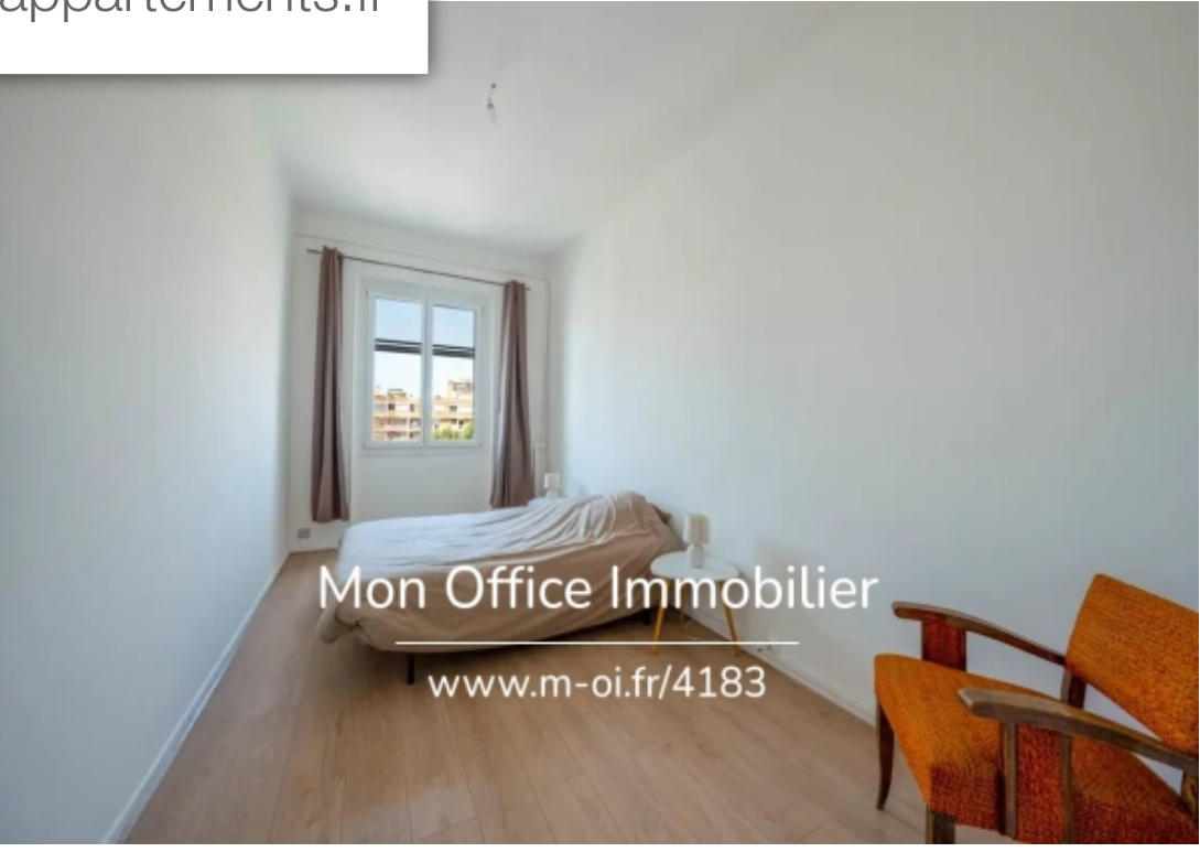
Mon Office Immobilier www.m-oi.fr/4183