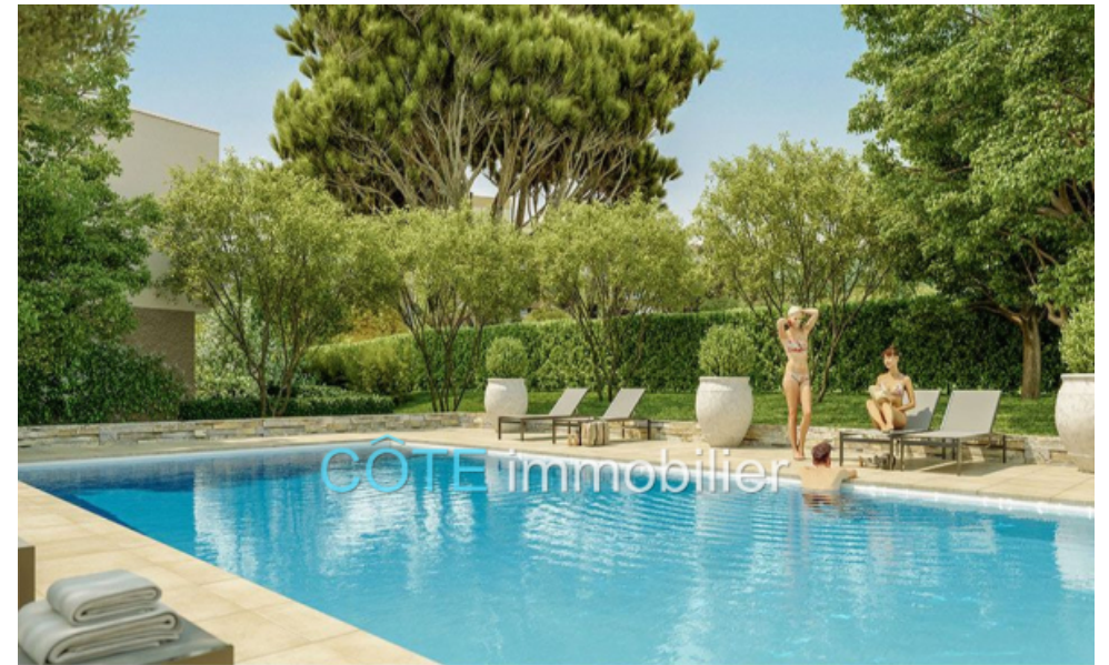
Programme neuf - Convention milancip - MLS Côte d'Azur