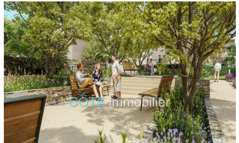
Programme neuf - Convention milancip - MLS Côte d'Azur