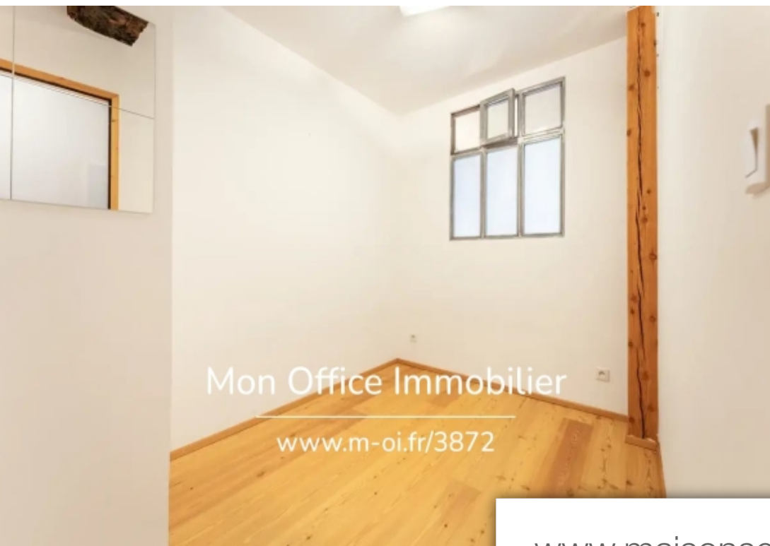
Mon Office Immobilier www.m-oi.fr/3872