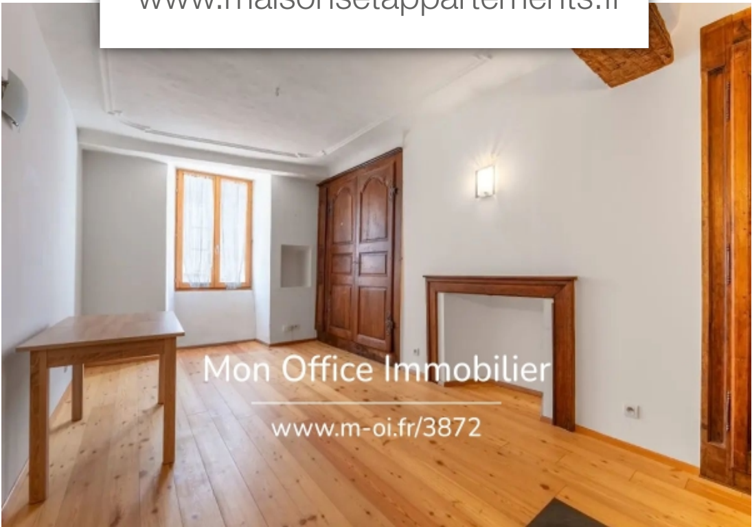
Mon Office Immobilier www.m-oi.fr/3872