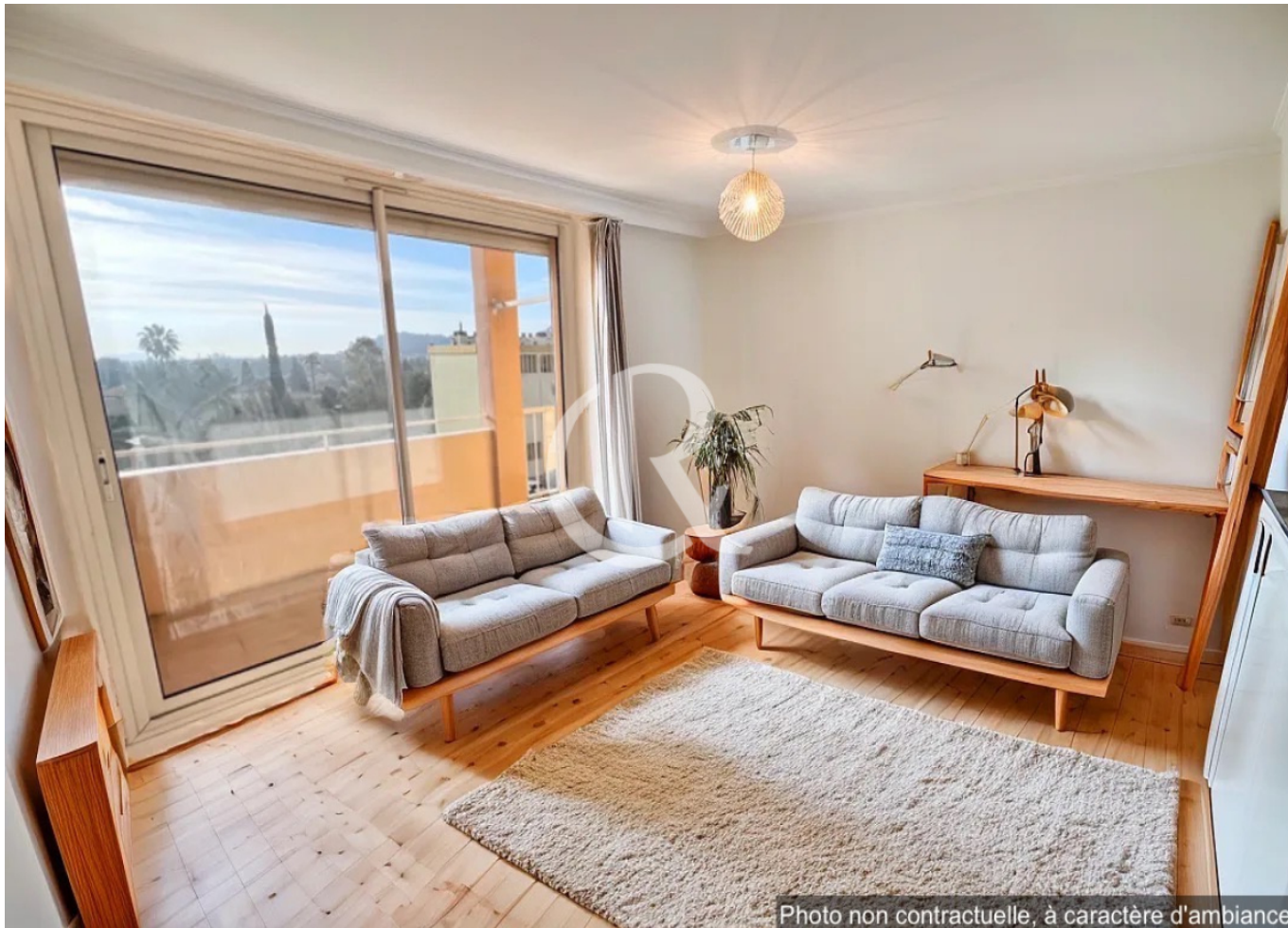
Photo non contractuelle, à caractère d'ambiance