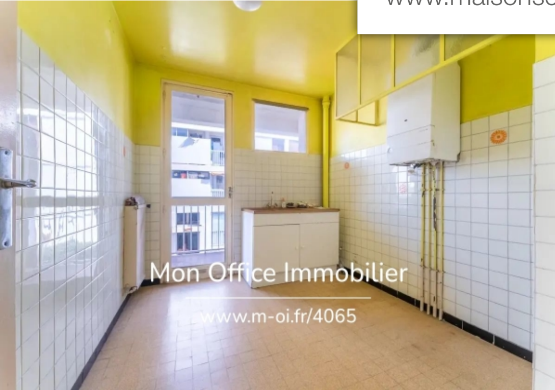
Mon Office Immobilier www.m-oi.fr/4065