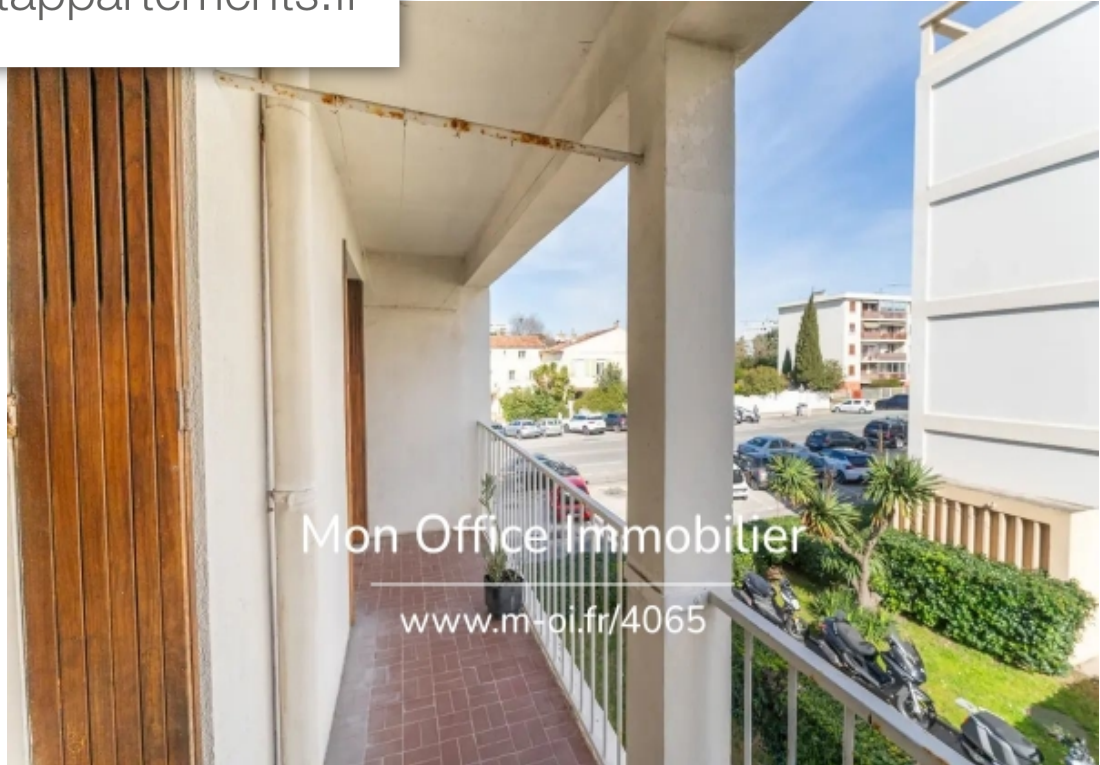
Mon Office Immobilier www.m-oi.fr/4065