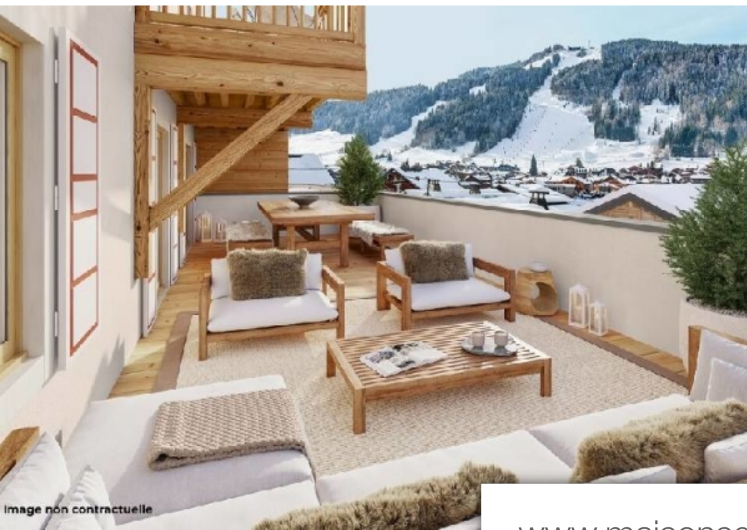
Image non contractuelle