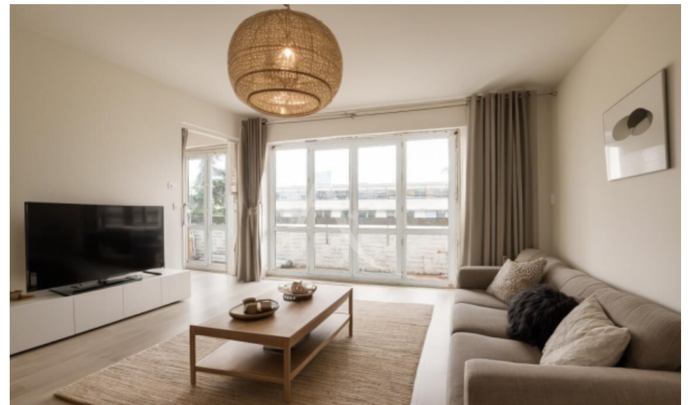
Proposition d'aménagement virtuel non contractuelle