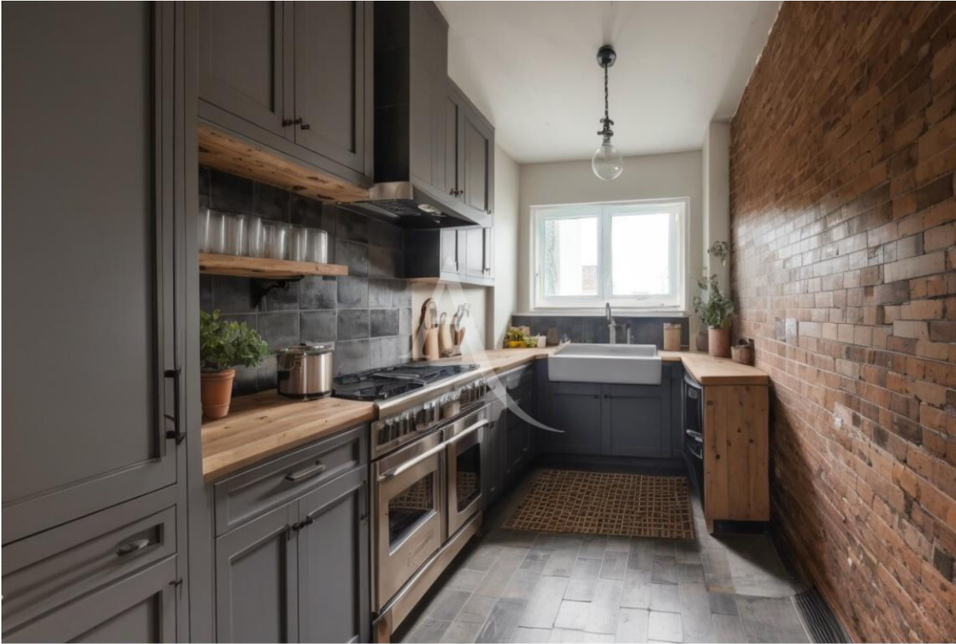
Proposition d'aménagement virtuel non contractuelle proposée