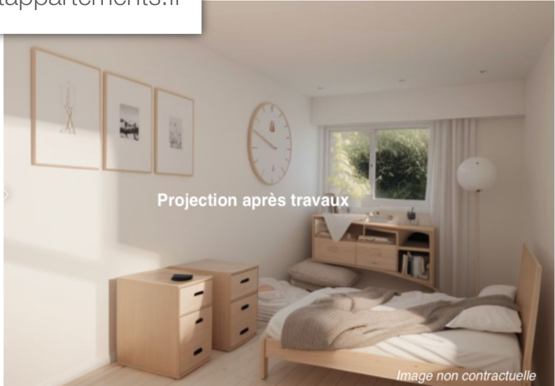
Image non contractuelle