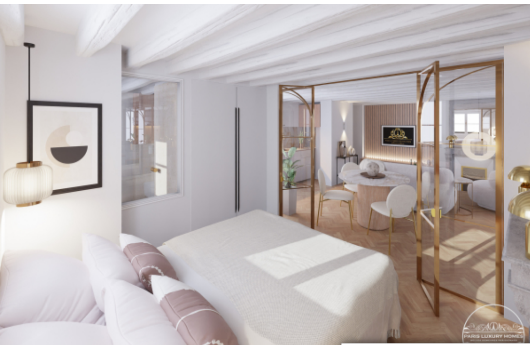
Photo non contractuelle montrant l'appartement après travaux