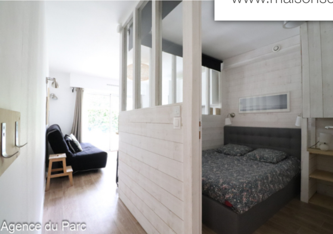
Agence du Parc