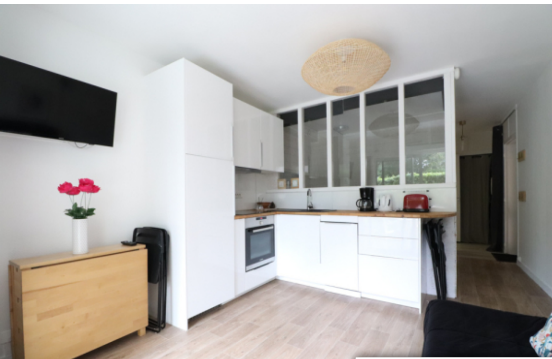
Agence du Parc