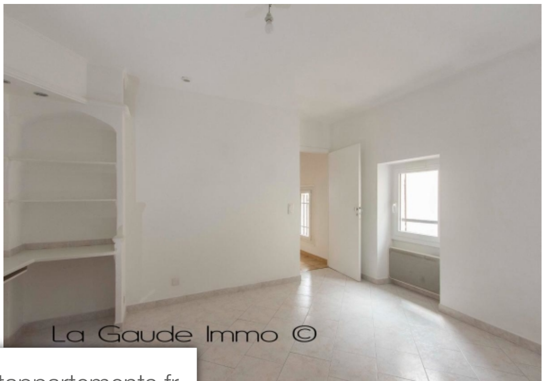
La Gaude Immo ©