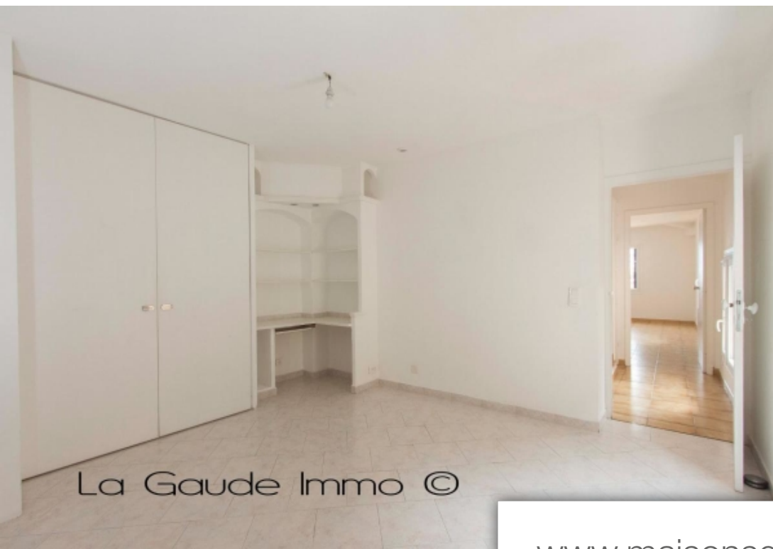
La Gaude Immo ©