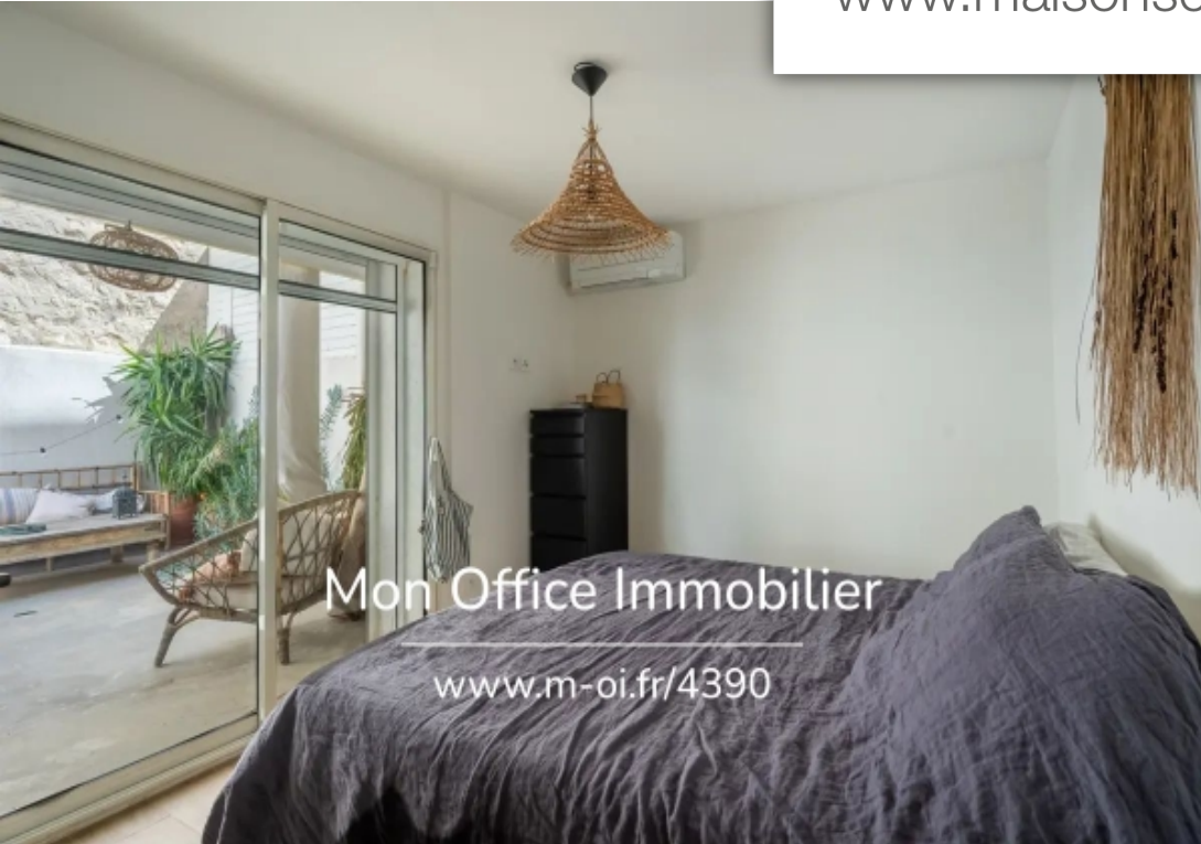
Mon Office Immobilier www.m-oi.fr/4390