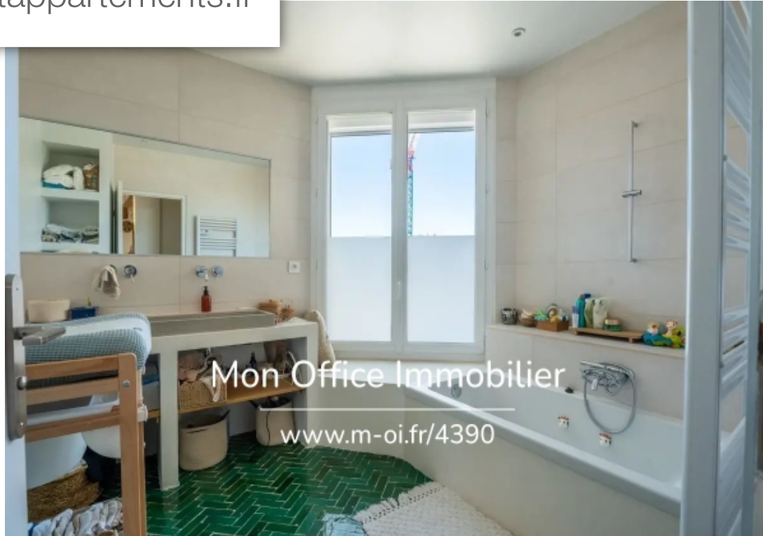
Mon Office Immobilier www.m-oi.fr/4390