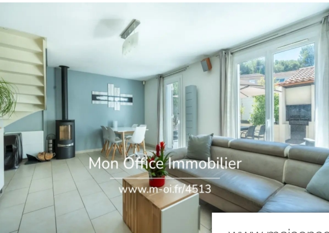
Mon Office Immobilier www.m-oi.fr/4513