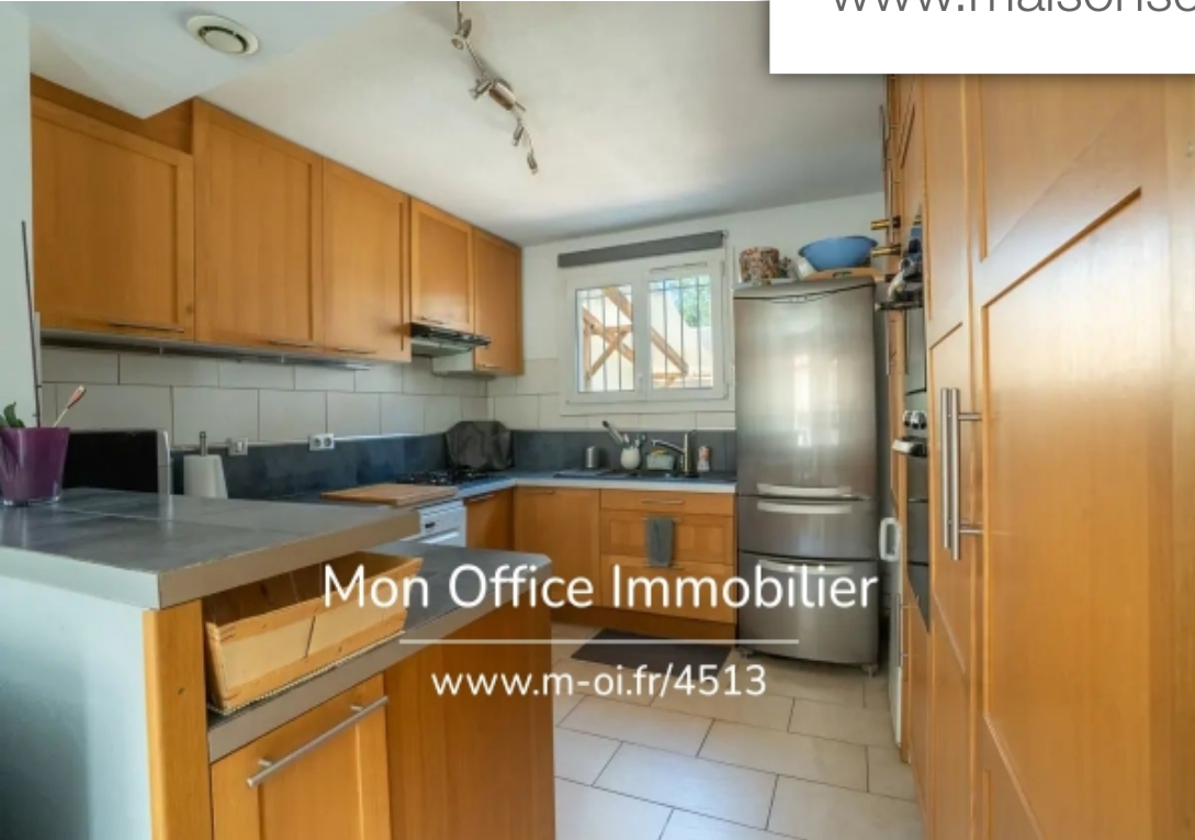
Mon Office Immobilier www.m-oi.fr/4513