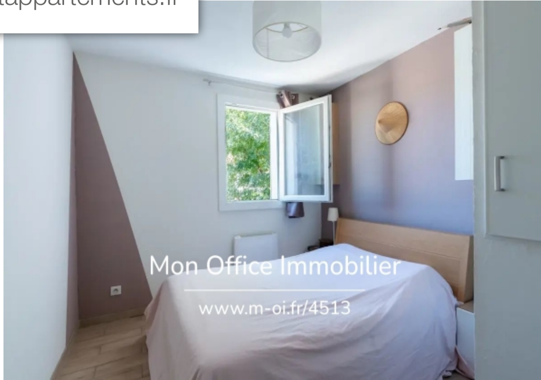
Mon Office Immobilier www.m-oi.fr/4513