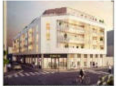
Résidence Urban Lodge

Niveau : R+1 / Raz-de-jardin Logement : T2 E 103 Bâtiment E